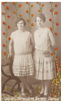
Jours, Semis et Entre-Deux